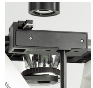
Koaxiale Triebknöpfe für x/y Anbringung links oder rechts möglich