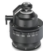
Condenseur « Swing-Out »