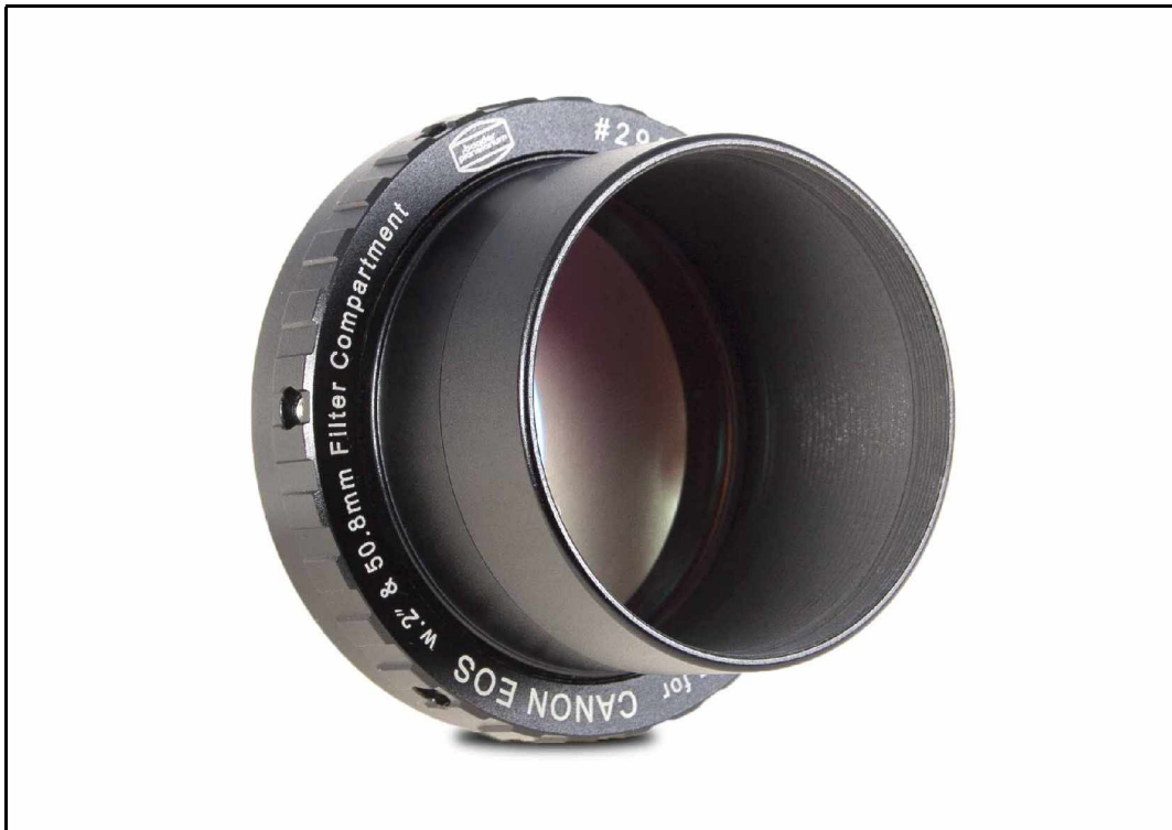
Abb. 3 – Ansicht: Protective T-Ring for Canon EOS mit 2" Steckhülse (S52/2")