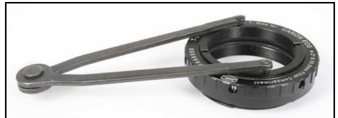
Abb. 8A: Optionaler, verstellbarer Stirnlochschlüssel 2mm (#2450062)