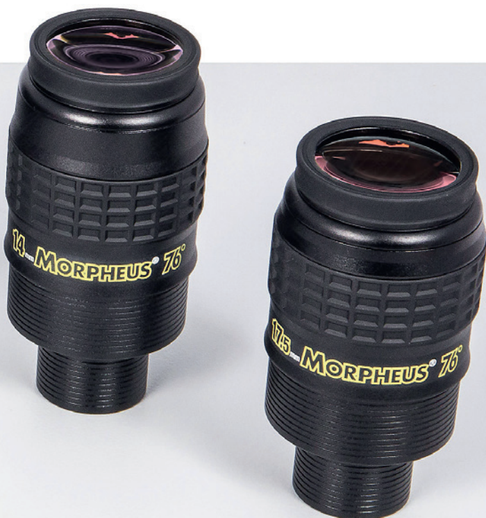
◀ Abb. 1: Die neuen Morpheus-Okulare von Baader Planetarium sind in sechs Brennweiten zwischen 17,5mm und 4,5mm erhältlich.

Die selbstleuchtende Beschriftung ist praktisch, insbesondere wenn mehrere Okulare aus der Morpheus Reihe eingesetzt werden, da die Okulare sehr ähnlich aussehen. Durch die zwei mitgelieferten Augenschalen hat der Beobachter die Möglichkeit seine bevorzugte Variante zu wählen.